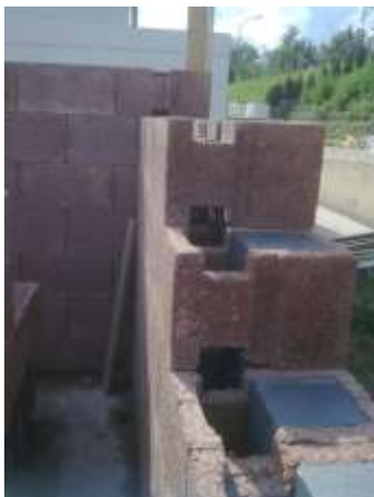
Aus der Ecke heraus aufstapeln