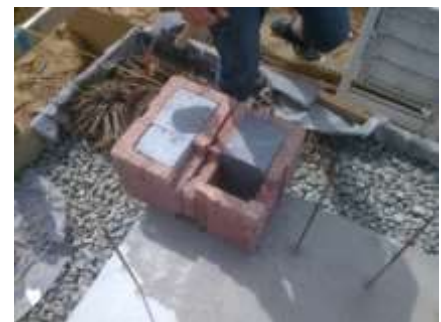
Bild rechts: Die erste Steinschicht wird mit dem höhengleichen Setzen aller Ecksteine begonnen.

Holzspan- Wände werden ohne Mörtelfugen fugenfrei errichtet. Die erste Steinschicht allerdings wird in Zementmörtel gesetzt um für die Folgeschichten einen gleichmäßigen Wandaufbau durch das einfache Aufstapeln der einzelnen Bausteine zu erreichen. Für die Wanderstellung eignen sich handwerkliche durchschnittlich begabte Baulaien genauso wie kreative Baufachleute. Allen Bauausführenden gemeinsam sollte der Spaß am erschaffen von Werten sein.